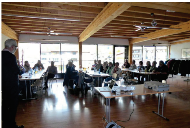
Teilnehmer mit Referent

22. März 2017 13:22 Akt.: 22. März 2017 13:23